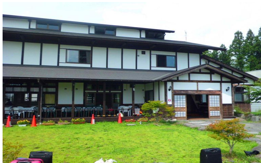
人工芝2面の環境とそれに隣接した古民家風クラブハウス