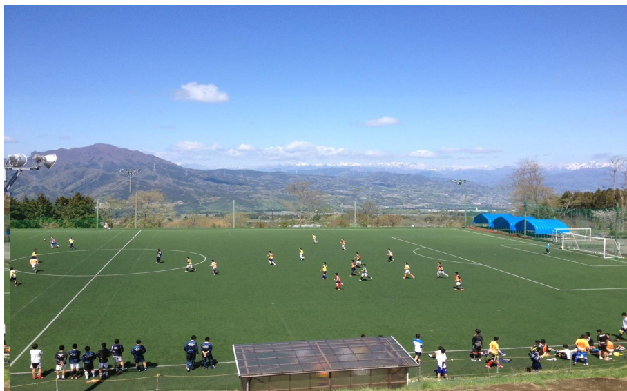
【千年の森J-wingsスポーツセンター】