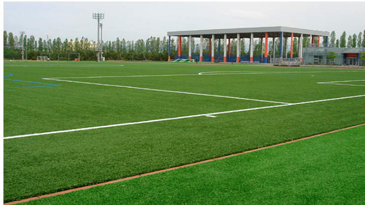
国内最高峰のサッカー環境が整ったグラウンド設備!!