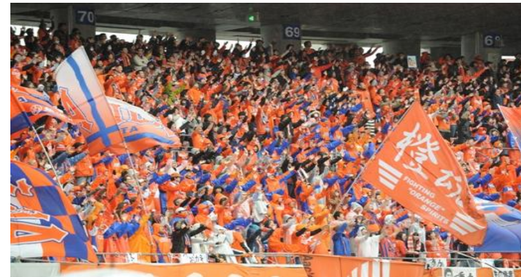
国内最高峰のサッカー環境が整ったグラウンド設備!!