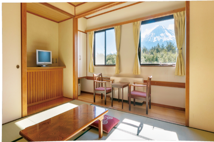
『富士緑の休暇村宿泊施設イメージ①』