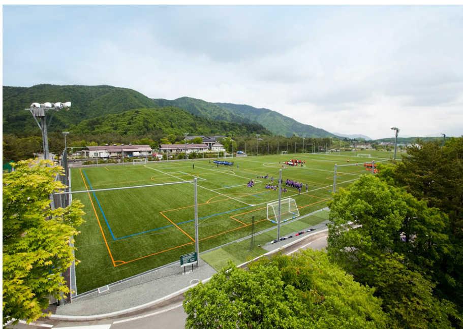
『富士緑の休暇村グラウンドイメージ①』