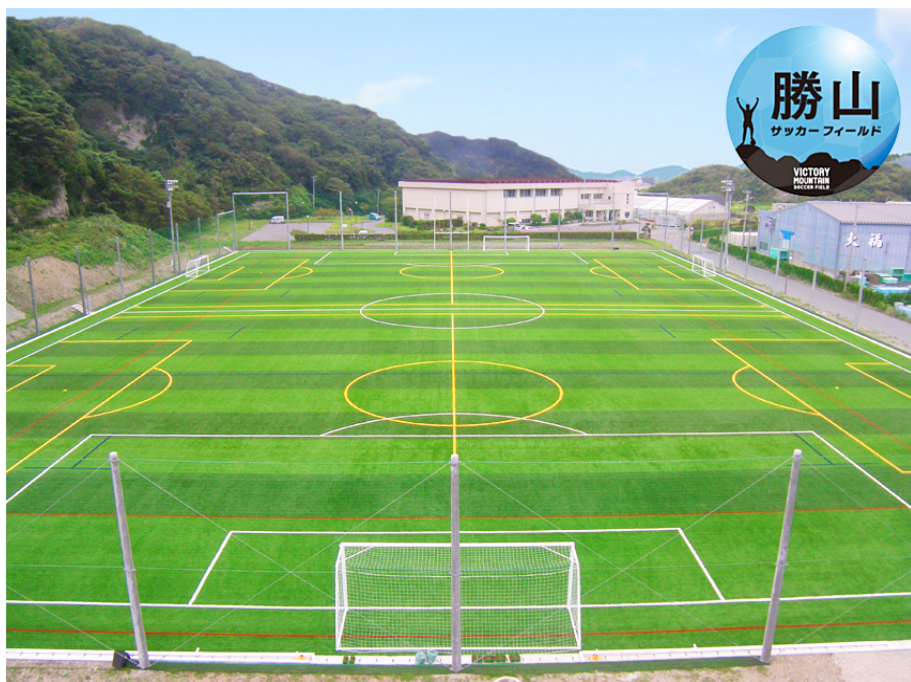
『勝山フィールド全体イメージ』