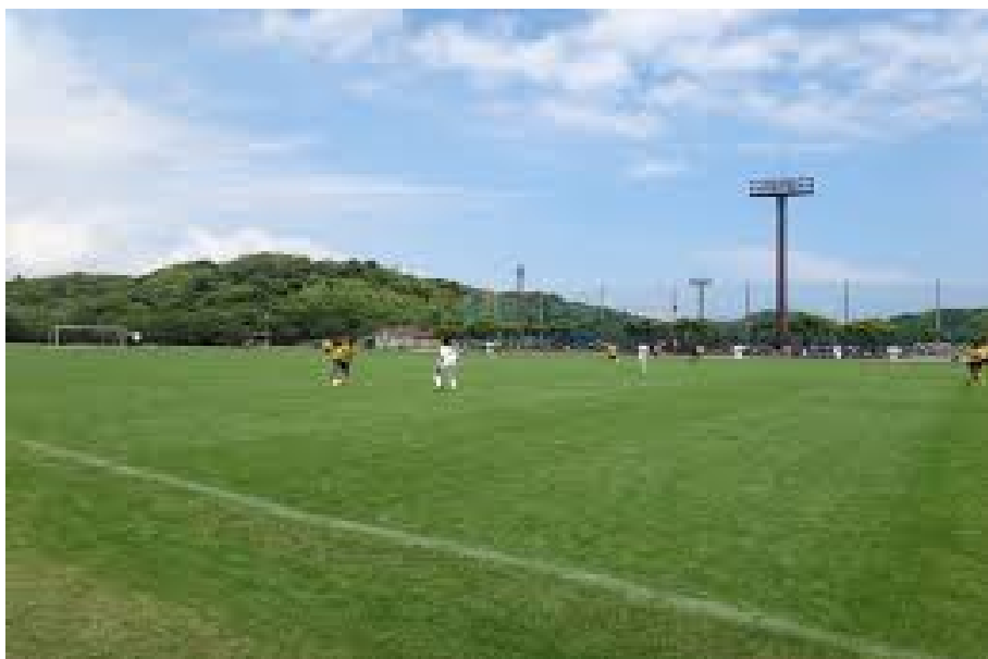
『千倉総合運動公園多目的広場イメージ』