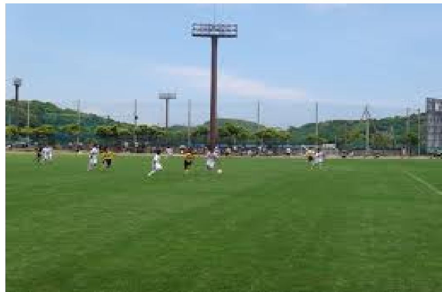
『千倉総合運動公園多目的広場イメージ』