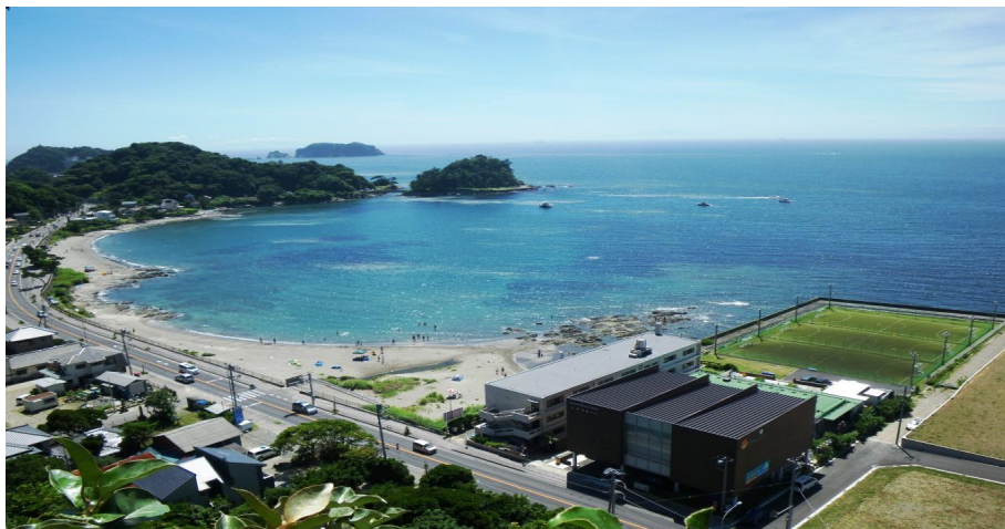
サンセットブリーズ保田上空からのイメージ